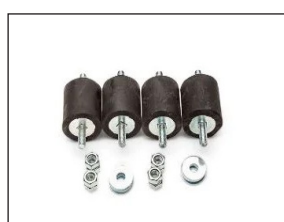
Vibrasjonsdemper - ANA4040