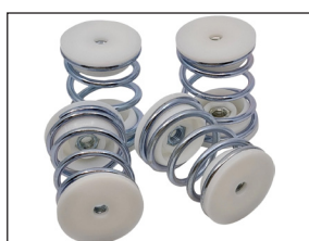
Fjærdempere - AFA800