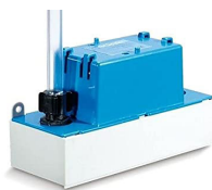
EE150 - Pumpe m/tank.