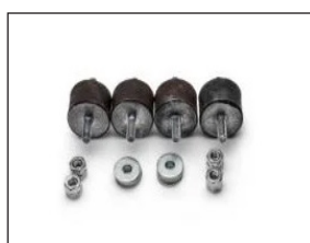
Vibrasjonsdemper - AA5030