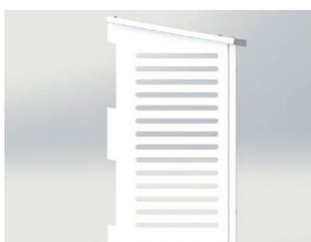
Varmpumpehus - Pro Cage