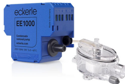
EE1000 - Sugepumpe, tretrinns flottørbryter styrer pumpen.