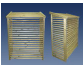
Hus for utedel i trevirke - H900 C-001 XL