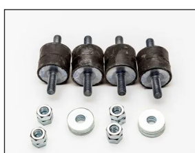
Vibrasjonsdemper - VV3025