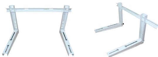
Brakett med skinne, innebygd vater, vibrasjonsdempere og festemateriell.