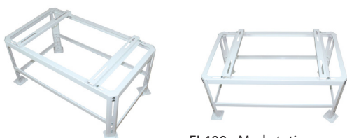
FL400 - Markstativ