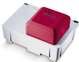
EE1650 - Pumpe m/tank, to flottører som opererer separat.