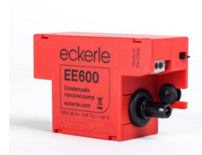
EE600 - Sugepumpe, med flottørmodul. Tretrinns flottørbryter styrer pumpen.