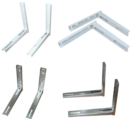
WEB - Veggbrakett, fast, sveiset.

Disse brakettene er stort sett laget av metall eller et annet slitesterkt materiale, og er designet for å holde vekten av varmepumpen og tåle naturkreftene som vind og regn.