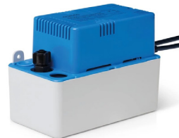
EE300 - Pumpe m/tank.