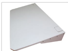
Tak til utedel