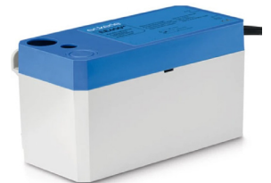
EE400 - Pumpe m/tank, svært stillegående og vibrasjonsfri.