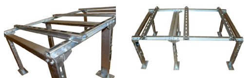
FLH450 - Markstativ - extra heavy. Tåler opptil 750 kg.