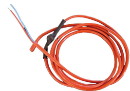
VK75T - Varmekabel med termostat. Varmekabelen består av enkeltledere som gjør den "formbar" og enkel å montere. Tetthetsgrad: IP44